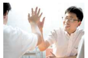
▲楽しくスキルアップ!

A型事業は営業形態を昼のみに統合し、より働きやすい職場環境を整えます。広報ではSNS活動を強化し効率的な集客を目指します。B型事業は一人ひとりが活躍できる環境を整えて作業量の増強やスキル習得を行い、工賃向上を図ります。地域行事にも積極的に参加し、利用者間の交流だけでなく、地域とのつながりを深めます。