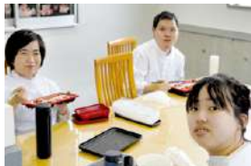
▲新しい休憩室でお昼ご飯

B型事業では、カット野菜工場内に休憩室と実習室を作りました。作業スペースの拡張により、カット野菜の増産にも対応でき、実習生を今まで以上に受け入れることが可能になりました。B型就労からA型雇用へのステップアップの場になればと期待しています。