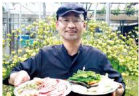
▲自慢のおいしい和牛を召し上がれ!

宿泊事業では、久住高原の地の利を生かし、夏季の合宿誘致を強化します。また、竹楽やキンダーフェストといった各種イベントの企画、出店を行い、地域との積極的な交流を行います。くじゅう連山をはるかに望む豊かな自然環境を生かした、ここでしかできない楽しい取り組みを行っています。