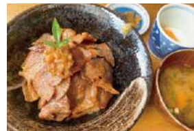
▲新作 豚みそ丼(くたみ豚使用)

日乃出茶寮は「地域のサロン」として温泉や各種教室で日乃出会員の方にゆったりと楽しんでいただき、地元の皆さんには“往時の町の賑わいの復活”を実感できる公演やイベントの開催を行います。