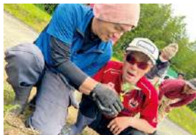
▲100本のひまわり植え

発想豊かなイベント、文化活動、障害者スポーツや音楽活動を始め、インターネットを利用した動画視聴やゲーム等の活動を取り入れ、施設生活をより「楽しい!」と思えるよう支援に取り組んでいきます。