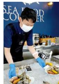
▲新鮮な海鮮をどうぞ!

また、浜いちご園では苗の育成、果実工房はアイスクリーム等の新商品開発を行い、多くのお客様に満足していただけるよう、利用者さんの意見やアイデアも取り入れ運営をしていきます。