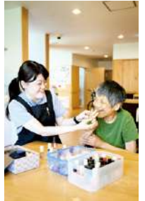
▲おしゃべりして楽しい!

重度高齢化の進む第一博愛寮では、利用者さんと職員の体の負担軽減が期待されるノーリフティングケアを行っています。既に定着した男性棟に引き続き、本年度は女性棟でもノーリフティングケアを定着させます。博愛診療所と連携し、ご本人やご家族の意思を尊重した「博愛会の看取り」のあるべき姿を提示できるよう取り組みます。