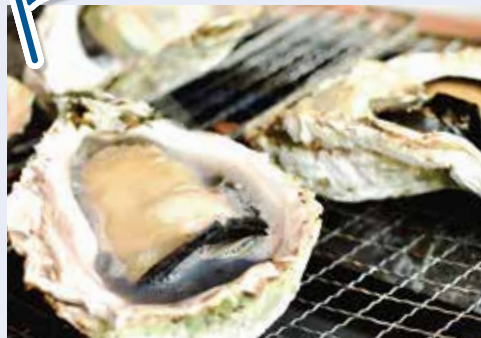
▲大きくてジューシーな岩牡蠣をご堪能ください!

練習して自信をつけた後、職員や先輩従業員さんのフォローを受けながら実際に仕事をしてみます。「この仕事は難しいかも」といった先入観が見事に覆り、今では誰よりも頼れる若手従業員さんになりました。 このようにキツキテラスでは、適材適所の配置はもちろん、従業員さんの新たな「挑戦」もできる、働く喜びのある場所となっています。