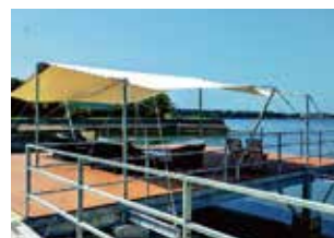
▲リニューアルしたテラス