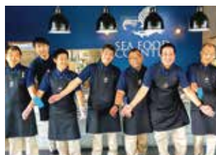
▲皆様のお越しをお待ちしております！

支援学校からの入所者及びB型からの従業員さんの意向を確認し、一般就労やA型就労に進められるように支援していきます。県下の支援学校の進路指導の先生方との情報交換を密にして利用促進を図っていきます。