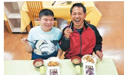
▲非常食を食べています