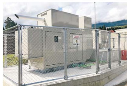
▲福祉農場コロニー久住に設置された非常時の保安用発電機