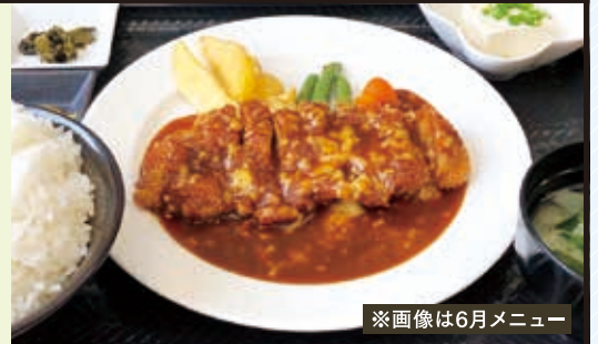
※画像は6月メニュー