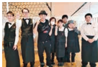
▼博愛大学校どりーむ 介護科開講式