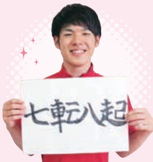
安東 天地 【第二博愛寮】

辛いことやできない課題に直面した時にこの言葉のように屈せず何事にも取り組みたいと思います。