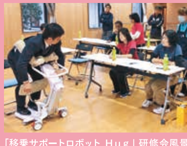
「移乗サポートロボット Hug」研修会風景