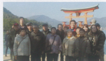
宮島の鳥居をバックに記念撮影