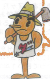
建設中のハーブ工房

今年の夏は記録に残る猛暑となりましたが、ダッシュ村では野菜や果物たちも暑さに負けず、甘い大きな実をつけてくれました。現在は、ハーブ工房の建設にとりかかっています。 今後陶芸工房も建設の予定です。春にはまた違ったダッシュ村をお見せできることと思います。