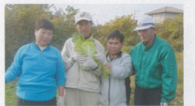
大きな白菜が採れました

4月に開設して以来半年が過ぎ、入居した皆さんは、日々の生活にも慣れてきました。日中活動の新メニューとして、福祉ホーム内外の環境整備、畑作業、時期に合わせた行事等を行っています。 畑作業では、今まで皆さんが培った経験をもとに野菜の栽培に取り組んでいます。先日は皆さんと旅行に行ってきました。今後は、クリスマス会や収穫した野菜を調理してのパーティなどを予定しており、皆さんとても楽しみにしています。 今後とも自分らしくぬくもりのある生活を実現させるよう創意工夫を重ねてまいります。機会があれば、春の風・庵にお越しください。