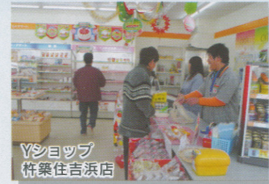
Yショップ 枅築住吉浜店

4月に開設して以来半年が過ぎ、入居した皆さんは、日々の生活にも慣れてきました。日中活動の新メニューとして、福祉ホーム内外の環境整備、畑作業、時期に合わせた行事等を行っています。 畑作業では、今まで皆さんが培った経験をもとに野菜の栽培に取り組んでいます。先日は皆さんと旅行に行ってきました。今後は、クリスマス会や収穫した野菜を調理してのパーティなどを予定しており、皆さんとても楽しみにしています。 今後とも自分らしくぬくもりのある生活を実現させるよう創意工夫を重ねてまいります。機会があれば、春の風・庵にお越しください。