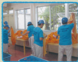
タオルの洗い・乾燥が終わるとみんなでたたみます。