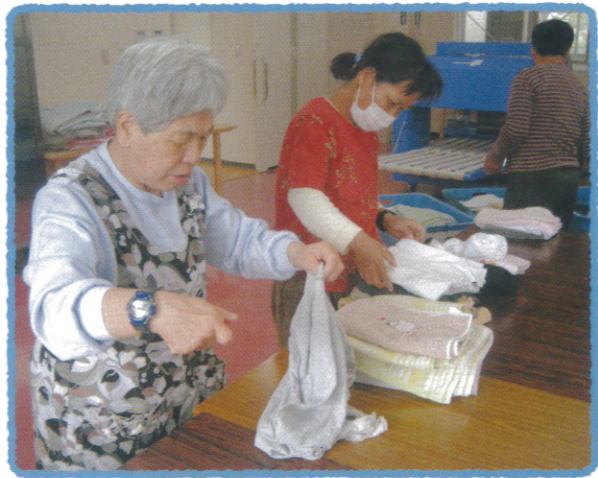
キッチン花亭クリーニング部での実習

福祉ホームや地域で生活している方については、当法人の事業所を利用してよかつたとの安心を提議できるよう、保健、医療、福祉と連携する中で、各事業所のサービスを組み合わせ、地域生活の維持に努めます。