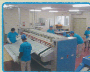
シーツローラーでシーツのしわを伸ばします。