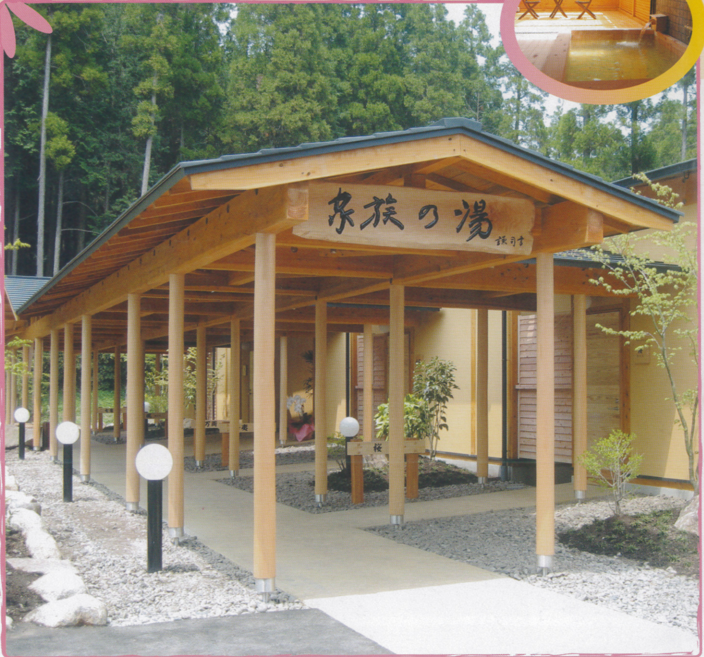
● 家族の湯(パルクラブ)