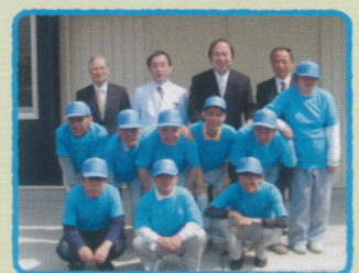
笑顔で頑張ります。