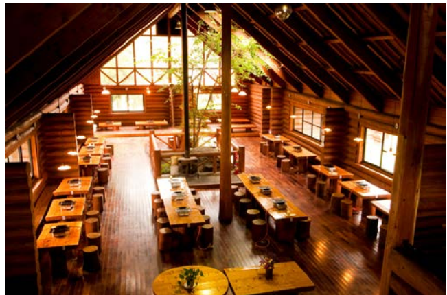
※写真はリニューアル前のものです。

本件に関するお問い合わせ・取材のお申込みに関する ご相談は担当者までお気軽にご相談ください。